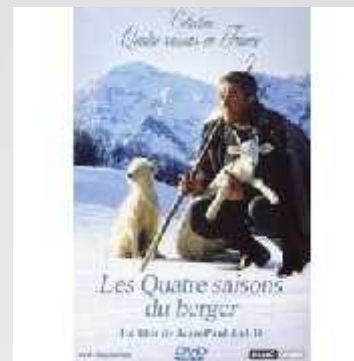
Les quatre saisons du berger

http://www.jplusb.fr/index.php?page=detail_film&id=21