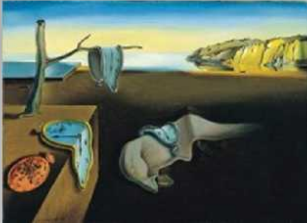
« La persistance de la mémoire » 1931