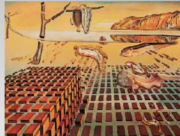
« Désintégration de la persistance de la mémoire » 1952