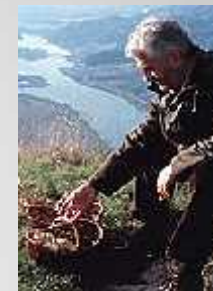
Quatre saisons pour un festin

http://www.jplusb.fr/index.php?page=detail_film&id=19