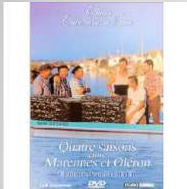
Quatre saisons entre Marennes et Oléron

http://www.jplusb.fr/index.php?page=detail_film&id=20