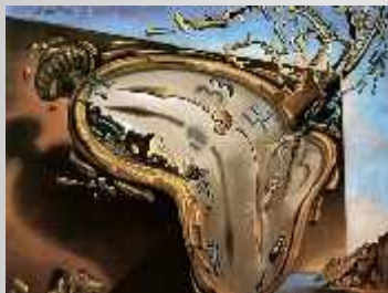
« Explosion de l'horloge » 1954